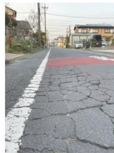
小作西部踏切の道路

また、あかしあ児童公園付近のLED照明灯の設置も皆さまの声を土木課に要請し、実現したものです。