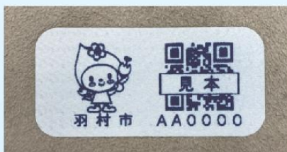
見守りシールの見本