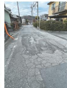
小作取水堰南の道路