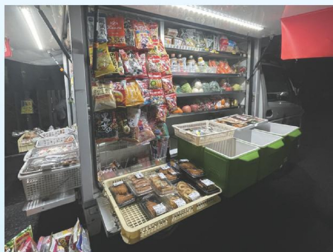
移動販売車の内部