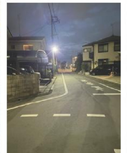
あかしあ児童公園付近のLED灯