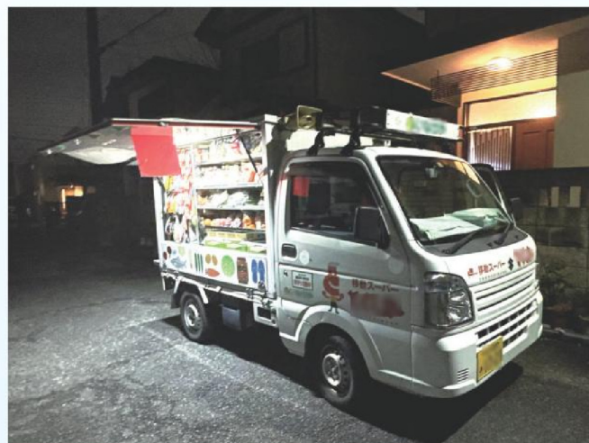
市内を巡回する移動販売車のひとつ

市長 市としては、こうした取組みを、より多くの高齢者や、そのご家庭に知っていただけるよう、引き続き、市公式サイトや広報はむら、メール配信サービス等を活用して情報発信していく。