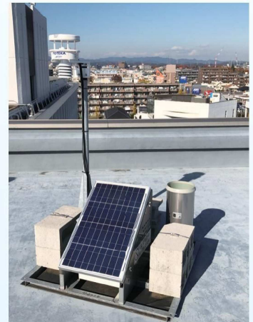
市役所屋上の「ポテカ」

市長 令和3年度完了に向けて防災行政無線のデジタル化を進めており、聴覚障害者のみの世帯への個別受信機と文字表示装置の貸与や、スマートフォンによる防災行政無線放送の受信アプリの導入について検討する。