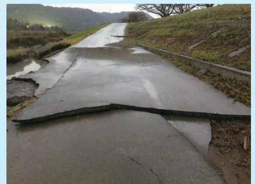
宮ノ下運動公園に通じる道路

市長 年内に行われる国の災害査定により、復旧に係る費用算定と供用開始の時期を示す。