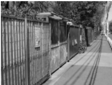
動物公園外周フェンス、 鉄部さび・腐食が進んでいる