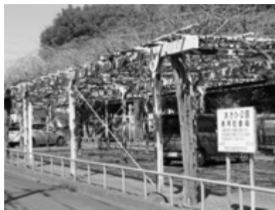
あさひ公園駐車場 鉄骨さび