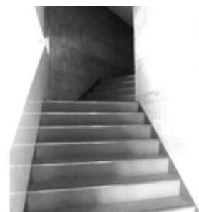
コミュニティセンターの 3階ホール階段