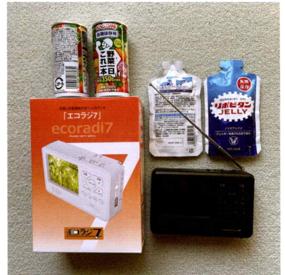
長期保存可能な栄養ドリンクとジュース 手回し式充電機能付きテレビ・ラジオ