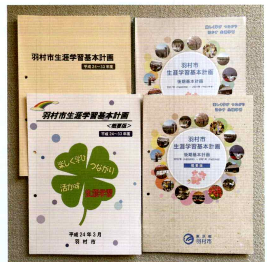
約10年前・約5年前の生涯学習基本計画(冊子とダイジェスト)