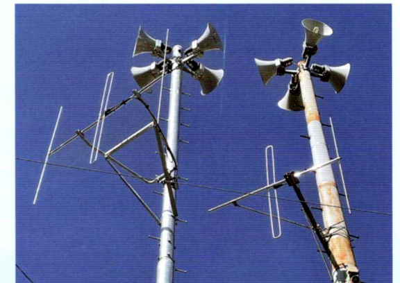
デジタル化整備工事中の防災行政無線 (左:デジタル化後 右:デジタル化前)