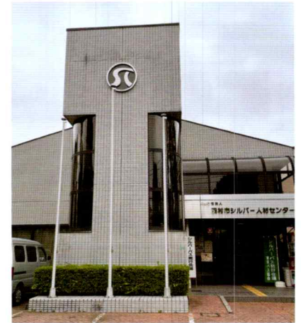
羽村市シルバー人材センター