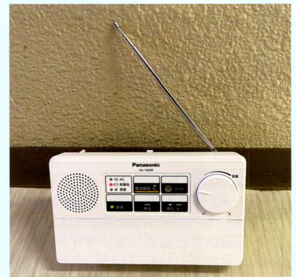
市が貸与する戸別受信機