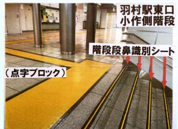
階段段鼻識別シート (発表で使用したパネル)

市長 市では、弱視者や高齢者が容易にに段差を判別できるよう、羽村駅及び小作駅の自由通路にある階段に、段差目印テープを貼り、視認性の向上を図っている。今後も自由通路全体の安全対策に努める。