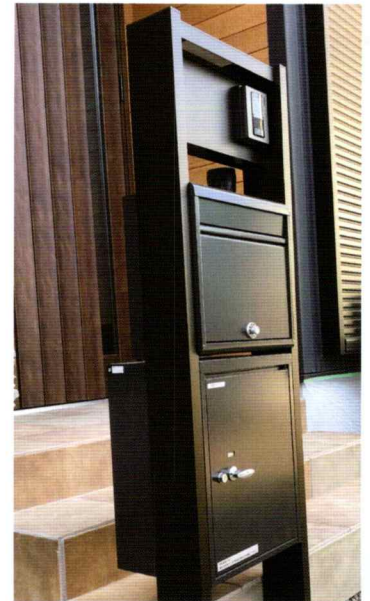
宅配ボックス（下段）

市長 AZEMSをはじめ、公共施設への太陽光発電施設の設置、電気バスはむらんの運行や庁用車の買い替え時における電気自動車の導入など、CO2削減に向けた取組みについても、今後も引き続き、地球温暖化対策の一環として、取組みを図っていく。