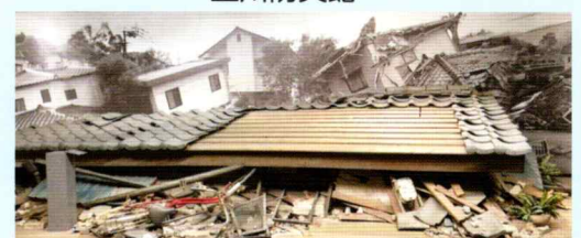
救出救助コーナー